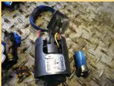
ハンディクリーナー